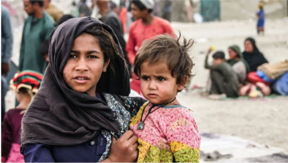
Siblings who arrived from Afghanistan with their families are seen in Pakistan on Sept. 1. Thousands, if not millions, of people are expected to attempt to escape Afghanistan, leaving nations in the region anxious about a flood of refugees coming in.

地處中亞十字路口的阿富汗長年戰亂、政局動盪。塔利班奪權后引發大量百姓逃往鄰國邊境，淪落為流離失所的難民群體。百萬難民危機帶來緊迫且長期性的需要，他們面臨缺乏生活物質、心靈極度困苦處境，是在黑暗中等候「好消息」的群體。